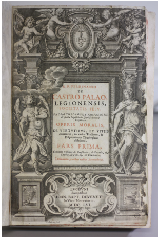
Operis moralis, F. Castro Palao

Une importante section du fonds se compose de théologie : des ouvrages sur certaines questions très précises mais aussi des manuels de théologie dogmatique universelle et de très nombreux livres de théologie morale et de casuistique, à l'usage des séminaristes ou des prêtres. Ces ensembles permettraient assez aisément la reconstitution d'une histoire de la formation des ecclésiastiques, ainsi que d'une histoire des mœurs, car beaucoup de cas de conscience y sont examinés.