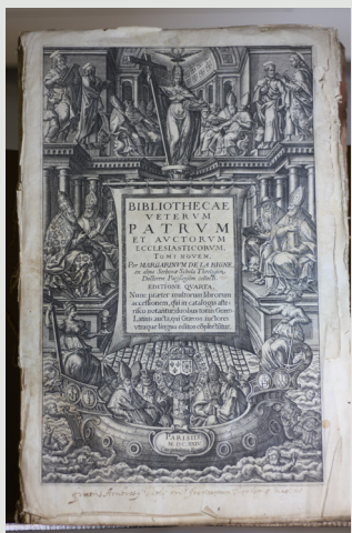
Bibliothecae veterum Patrum et auctorum ecclesiasticorum , Marguerin de la Bigne

Dans le domaine de la patristique et des écrits de docteurs, nous disposons de deux types d'ouvrages : des mélanges, qui traitent des Pères en général, de leur histoire, de leur influence ; puis des volumes consacrés à un auteur en particulier.