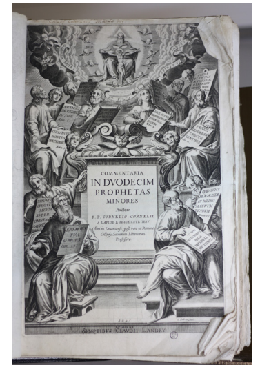
Commentaria in duodecim Prophetas minores, Cornelius a Lapide

L'intérêt de ce corpus réside aussi dans le fait qu'il rassemble les travaux de certains cardinaux importants, tels que ceux du docteur jésuite saint Robert Bellarmin . Enfin, outre les oeuvres exégétiques de Estius , nommé doctor fundatissimus par Benoît XIV, deux blocs doivent absolument être signalés : ce sont les séries de commentaires bibliques – possédés dans leur quasi-intégralité par l'ICES - de Van den Steen , qui tenait lieu d'expert biblique dans les débats entre catholiques et protestants, et d' Augustin Calmet .