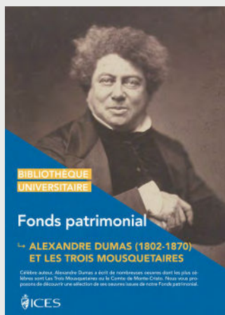
Table thématique Décembre 2023

Cette bibliographie vous propose une sélection de ressources, disponibles à la BU ou en ligne, en lien avec Alexandre Dumas (biographies, analyses littéraires et romans) et sur l'étude de son oeuvre Les Trois Mousquetaires .