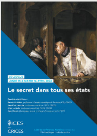
Table thématique Avril 2024

A l'occasion du colloque organisé à l'ICES, les 15 et 16 avril 2024, la BU vous propose une sélection d'ouvrages en lien avec les différents concepts que recouvre le mot « secret ».