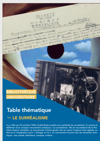
Table thématique Novembre 2024