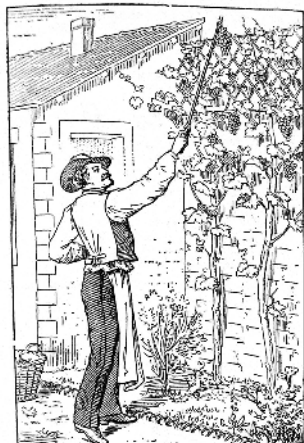
Cueillette fruitière. — Fig. 202.